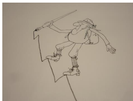
„Der Bergfex“ 1967