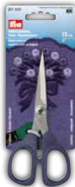
Stick-/Bastelschere, 13 cm = 5" Art.-Nr. 611 510