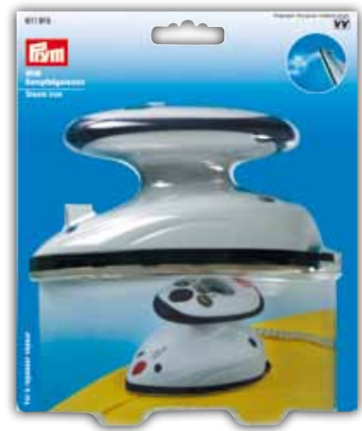
Dampf bügeleisen, Mini Art.-Nr. 611 915 Art.-Nr. 611 916 (für UK)