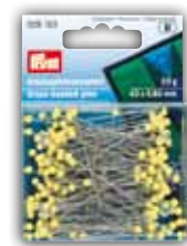
Glaskopfstecknadeln, gelb, 20 g Art.-Nr. 029 153