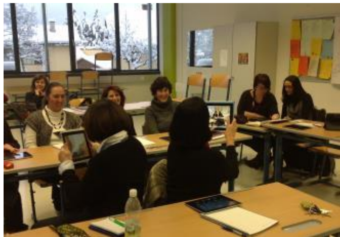
Abbildung 1: Kolleginnen fotografieren und filmen mit dem iPad

Evernote ist eine App, die die Sammlung von Notizzetteln, Skizzen auf losen Blättern und Computerausdrucke und vieles andere mehr ablöst und auf dem iPad übersichtlich sammelt. Mit Evernote kann man schnell Notizen machen, Fotos aufnehmen, Aufgabenlisten erstellen, Spracherinnerungen aufzeichnen und diese Notizen durchsuchen. Zur Produktfamilie von Evernote gehört die App Skitch . Zu Bildern und Texten können mit Pfeilen, Stempeln, Formen, Text u. a. m. Anmerkungen gemacht werden. Es kann auch etwas Neues gezeichnet oder skizziert werden. Mit Skitch wird beispielsweise das Rückmeldung zu Texten oder Designentwürfen erleichtert, oder Kartenmaterial kann mit Wegbeschreibungen versehen werden.