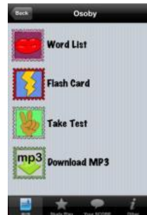
Abbildung 3: Screenshot 50 languages

Wenn die SchülerInnen Dialoge vorbereiten und filmen, nehmen sie mit dem iPad und der eingebauten Kamera ein Video auf und schneiden mit der App iMovie einen Trailer oder einen ganzen Film daraus.