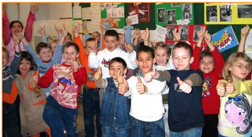
„Wir alle sind Gewinner!“

Dieses Projekt wird allen sicher noch sehr lang in Erinnerung bleiben und die 1. und 2. Klassen werden sich garantiert schon auf ihre Volksschul-Uni freuen!