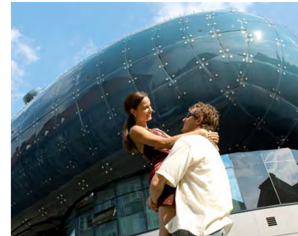
Modernes Kulturzentrum: Das Kunsthaus Graz mitten in der Altstadt