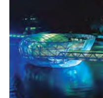
Murinsel Graz: Cafe und Bühne am Wasser

Urbanes Feeling, mediterranes Flair und eine ausgeprägte Gastro-Szene: Kein Wunder, dass Graz als „junge“ Stadt bekannt ist. Die Murmetropole ist ein äußerst attraktiver Studienstandort – unter etwa 250.000 Einwohnerinnen und Einwohner mischen sich rund 40.000 Studierende an acht Hochschulen. Mit der historischen Altstadt, der „roten“ Dächerlandschaft, die sogar UNESCO-Weltkulturerbe ist, zeitgenössischer Kunst und Musik sowie architektonischen Highlights zeigt sich Graz auch abseits des Studentenlebens sehr reizvoll. Und lädt zum Leben ein.