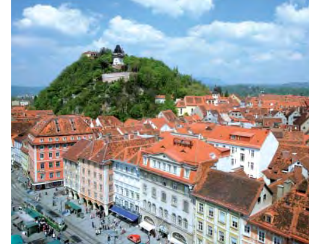
Weltkulturerbe: Die Altstadt von Graz mit dem Grazer Uhrturm auf dem Schlossberg