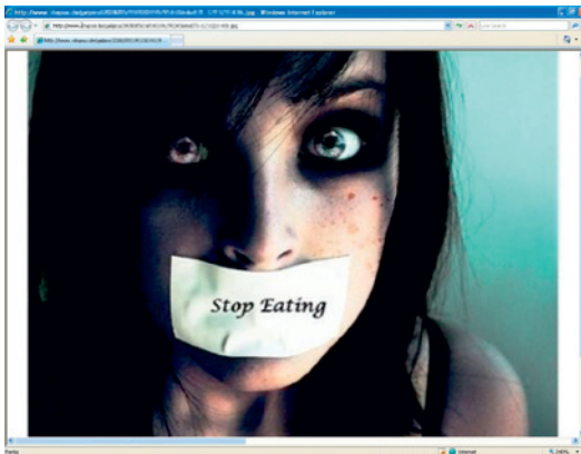
Verherrlicht und verharmlost: Essstörungen im Internet

Rund 22 Prozent der 11- bis 17-Jährigen in Deutschland leiden an Essstörungen wie Magersucht und Bulimie. Bei diesen schweren psychischen Krankheiten hungern sich die Betroffenen bewusst ins Untergewicht oder leiden an Ess-Brech-Sucht. Sie eifern einem krankhaften Schlankeitsideal nach, für das sie auch radikale, lebensbedrohliche Maßnahmen ergreifen: Etwa 20 Prozent aller Betroffenen sterben an den Folgen ihrer Essstörung. Magersucht und Bulimie sind oft nicht einfach zu erkennen, da die Betroffenen ihre Probleme vor ihrem Umfeld verbergen. Häufig beginnt die Krankheit in der Pubertät.